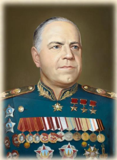
Жуков Георгий Константинович