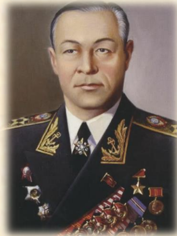
Николай Герасимович Кузнецов