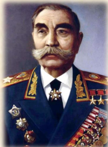
Семён Михайлович Буденный