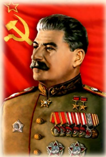
Сталин Иосиф Виссарионович