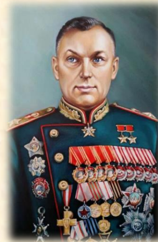
Рокоссовский Константин Константинович