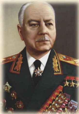
Климент Ефремович Ворошилов